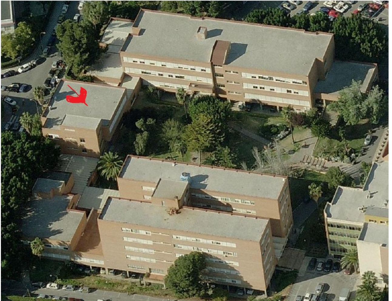
Mapa 2: Edificio Facultad Ciencias Económicas y Empresariales, UMA

La inscripción estará abierta el 12 de septiembre de 8:15 a 18:00 en el vestíbulo del segundo piso del edificio señalado en el Mapa 2. El mostrador de inscripción también estará disponible para ayudar todos los días durante la conferencia.